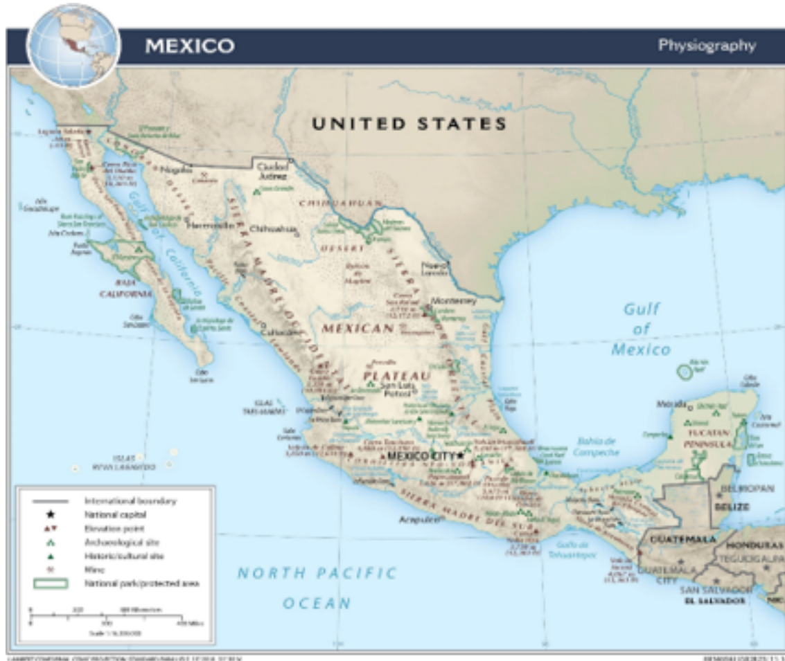
Figura 3 Fisiografía de México.

la seguridad a su población, esto implica generar condiciones mínimas para su desarrollo pleno; otro rubro relevante a considerar es la necesidad de preservar la democracia como la forma de gobierno que garantiza el pleno ejercicio de libertades y derechos para todos los mexicanos; cuarto, porque la defensa de la soberanía es la manera que se evita que sean intereses ajenos a la nación los que prevalezcan en perjuicio de los legítimamente buscados por el país.