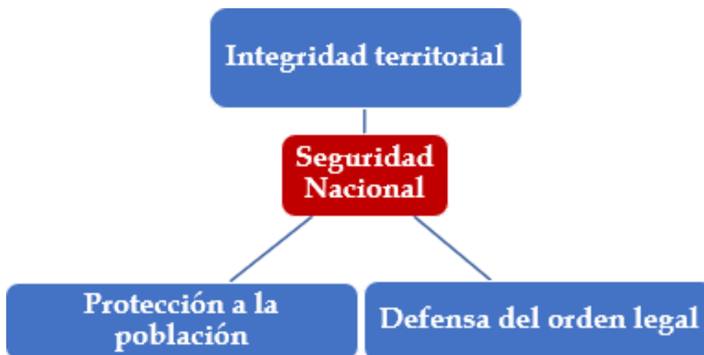
Figura 2 Responsabilidades de la seguridad nacional.

posición que guarda con el sistema internacional de países. De manera muy resumida se puede decir que la seguridad nacional más allá de si opera a nivel externo o interno de un país tiene tres grandes responsabilidades: 1) asegurarse de no perder territorio; 2) defender el orden legal e instituciones y 3) dar protección a la población ante cualquier amenaza (véase figura 2).