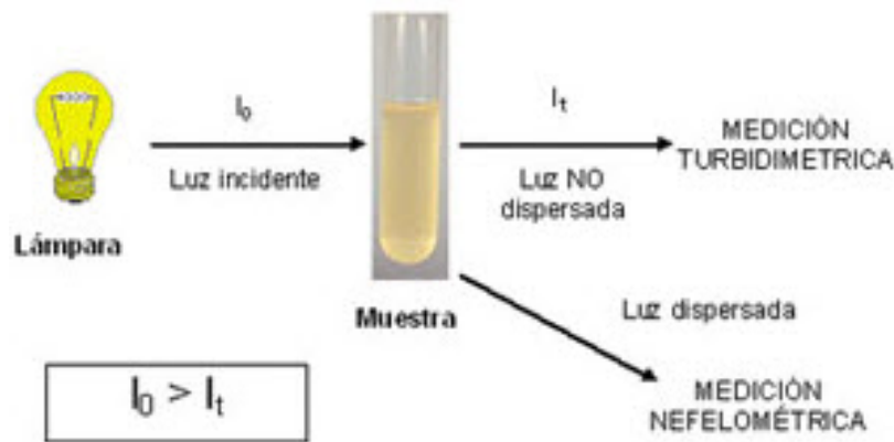
Figura 1: Principio de Operación de la turbidimetría.

Es una técnica basada en la dispersión de un haz de luz a través de una muestra acuosa por la cual se mide la disminución de la transmitancia del haz de luz al atravesar dicha muestra. El prototipo propuesto se muestra en la (figura 1) y opera bajo este principio. Se tiene un elemento generador de luz incidente, el cual proyecta un haz de luz a través de una muestra líquida en la cual se encuentran partículas sólidas suspendidas, la dispersión ocasionada por los sólidos suspendidos reduce la potencia lumínica, la cual es registrada por un elemento foto sensible con el cual se genera una diferencia de voltaje. Este voltaje es filtrado y acondicionado por un circuito electrónico el cual nos da una señal analógica la cual es procesada e interpretada, en este caso por un sistema embebido [7].