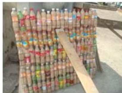
Muro de botellas de pet rellenas de tepetate

Las botellas de pet fueron rellenas con tepetate, el cual es un material que se destaca por su compactación y poca retención de humedad, que evita el desarrollo de la vegetación.