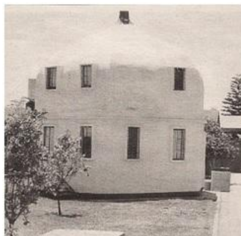
Construcción realizada con pet por el IPN en Mérida Yucatán, México