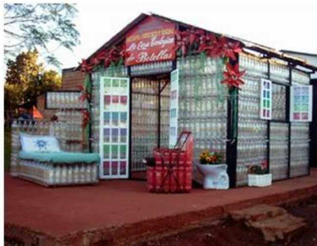
Vivienda construida con botellas de pet en Argentina

Existe a nivel mundial una gran variedad de propuestas para reutilizar y reciclar el pet en la construcción de vivienda, con la finalidad de favorecer a las comunidades de escasos recursos y de ayudar a limpiar el ambiente (Fraternali, Spadea y Berardi, 2014). En Latinoamérica la reutilización y reciclaje ha tenido éxito en los últimos años en países como Honduras, Uruguay, México (Gobierno del Distrito Federal, 2003) y sobre todo en Argentina (BARRETA, 2011; Bennaton, 2008), donde han tenido gran auge los proyectos con eco-tecnologías, elaborando elementos útiles para la vivienda como son tanques para contener agua o mobiliario para la misma vivienda (Alvarado, 2010).