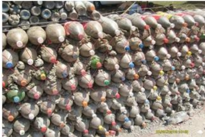
Muro construido con pet en Tlaxcala

Hasta el momento no se mencionan estudios o pruebas realizadas para demostrar que el ambiente interior es confortable, no se documentan temperaturas interiores, con las cuales es posible indicar el confort ambiental interno que tiene la casa, que le permitan al habitante disfrutar de cierto confort (Conacyt, 2010; Siegel y Howell, 2002).