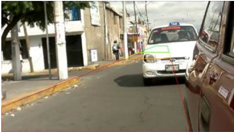
Figura 2. Líneas guía para el cambio de carril

A partir del video se toma la posición en la que se encuentra un carro u objeto para determinar que no se puede realizar cambio de carril, y se trazan líneas guías indicando con colores el riesgo de cambio siendo el verde un cambio de carril libre, esta vista es la que se va a visualizar en el sistema funcionando (Figura 2).