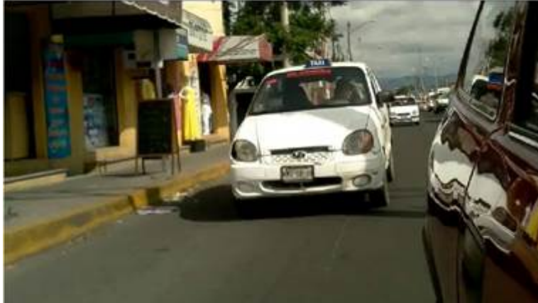
Figura 1. Imagen tomada con cámara colocada en el espejo lateral

A partir del video se toma la posición en la que se encuentra un carro u objeto para determinar que no se puede realizar cambio de carril, y se trazan líneas guías indicando con colores el riesgo de cambio siendo el verde un cambio de carril libre, esta vista es la que se va a visualizar en el sistema funcionando (Figura 2).