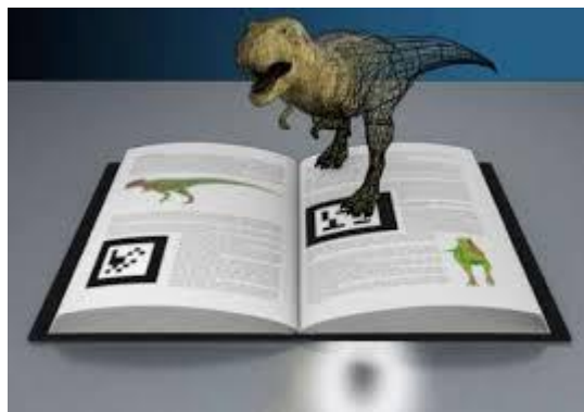
Figura 1. Realidad virtual.

En la actualidad las estrategias didácticas que se emplean a nivel mundial, hacen uso de tecnologías de la información (TIC) y con ello surgen beneficios pero también dificultades cuando se incorporan en el aula y esto mismo sucede cuando se incorpora la tecnología de la realidad virtual, como se muestra en la figura 2.