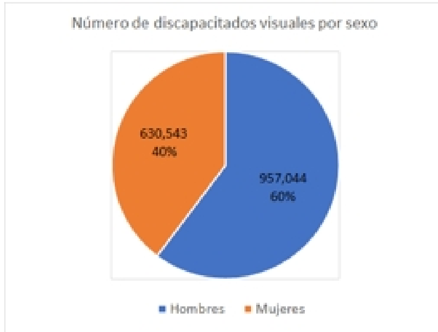
grafica 1. Promedio de ingresos de la población al trimestre por entidad federativa.

El ingreso mensual promedio más bajo, por hogar, de los discapacitados visuales por cada uno de los Estados de la República Mexicana, son Chiapas con $8,733.00 pesos; Guerrero con $9,751.00 pesos; Veracruz con $10,815.00 pesos; Oaxaca con $10,530.00 pesos y Zacatecas con $12,652.00 pesos.