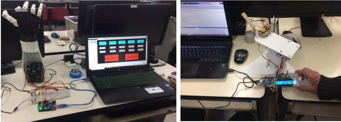
Figura 2. Proyectos finales presentados en la UAP Herramientas Computacionales.