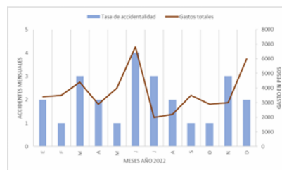
Figura 1 Estadístico de accidentalidad laboral Año 2022.

Para el año 2022 la empresa Grupo Milgre SA de CV, informa, a través de su departamento de recursos humanos, que en el área de oficina se presentó el mayor número de inasistencias relacionadas con 25 accidentes registrados. Entre los accidentes más significativos se mencionan la "Caída de trabajador por silla de escritorio en mal estado causando una lesión en cadera y columna" y "Accidente por mal carga de objeto (caja de archivo) dando como resultado fractura del dedo índice a trabajador". Por otro lado, la incidencia de estas ausencias y accidentes representan una pérdida de $44,600 pesos durante ese periodo, como se demuestra en la Figura 1.