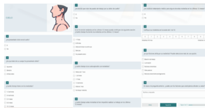
Figura 3 Ejemplificación de preguntas por zona del cuerpo analizada.

El resultado fueron 14 breves secciones, comenzando con los datos personales y la explicación del objetivo del cuestionario. Las siguientes secciones corresponden a las 12 distintas partes del cuerpo y contienen un listado de preguntas similares en cada sección y una imagen representativa de la parte del cuerpo analizada, tal como se ilustra en la Figura 3. Cada una de estas secciones, contiene las siguientes preguntas intercambiando la zona del cuerpo: ¿Ha presentado dolor en el cuello?; ¿De qué lado de su cuerpo ha presentado dolor?; ¿Cuánto tiempo tiene con las molestias?; ¿Ha tenido que rotar de puesto de trabajo por su dolor de cuello?; ¿Cuánto tiempo ha tenido las molestias en los últimos 12 meses?; ¿Cuánto tiempo dura cada episodio con molestias?; ¿Cuánto tiempo estas molestias le han impedido realizar su trabajo en los últimos 12 meses?; ¿Ha recibido tratamiento médico para alguna de estas molestias en los últimos 12 meses?; Califique sus molestias en la escala del 0 al 10; ¿A qué factores atribuye sus molestias?; En base a la pregunta anterior, ¿Cuáles son los factores que usted piensa afectan su salud?