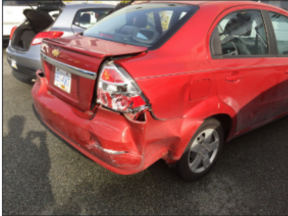
Figura .2 Choque en defensa trasera de un automóvil. Ryan. (8 de febrero de 2015).