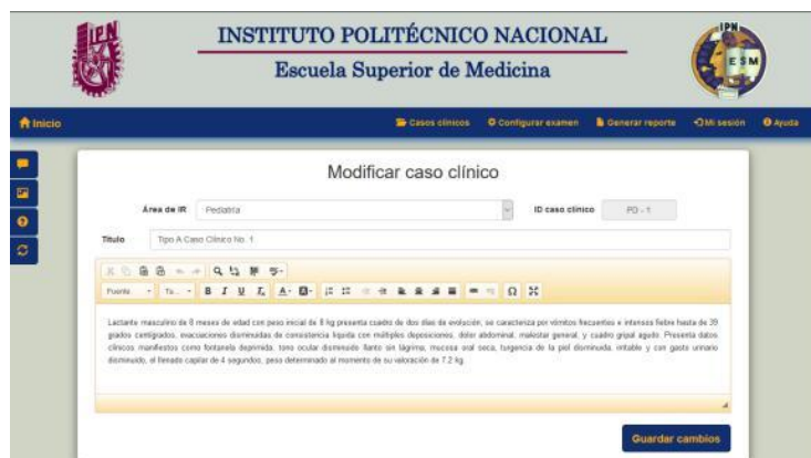
Figura 2.- Vista agregar y modificar caso clínico.

Un caso clínico consta de cuatro partes importantes, Narrativa del caso clínico, si conlleva una imagen o no, las preguntas y retroalimentación correspondientes. Para agregar un caso clínico, cada una de las partes se agrega de forma individual.