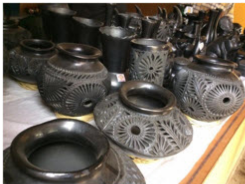
Figura 3. Pieza de barro negro terminada