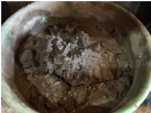
Figura 2. Arcilla para la producción de piezas de barro negro

Para lograr este proceso, la materia prima es el distintivo que permite identificar como una artesanía de origen de San Bartolo Coyotepec. La arcilla se extrae de "La mina", ubicada a dos kilómetros del centro de la localidad, en el Cerro del Coyote. Los lugareños son los únicos autorizados para extraer este material. En la Figura 2 se observa la materia prima, con su color característico, el negro.