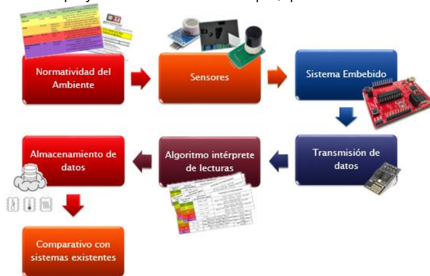
Figura 2. Etapas de proceso

Para el desarrollo del proyecto se identificaron 7 etapas, que se muestran en la Figura 2: